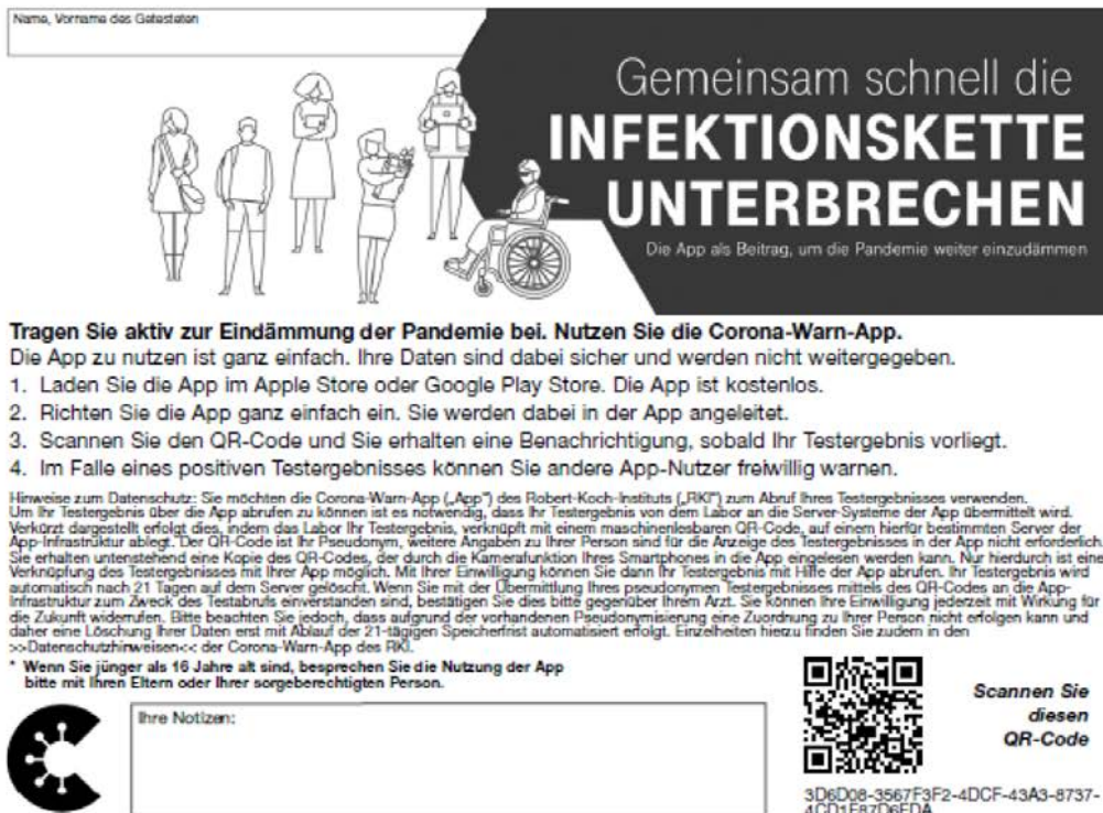
Abbildung 2. Vordruck Muster OEGD [18].